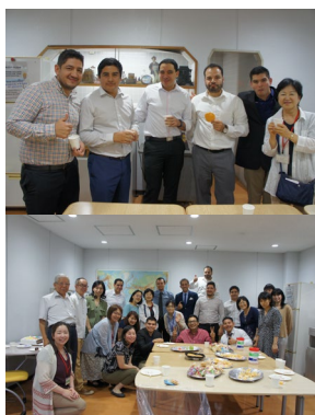
楽しむのは今です。