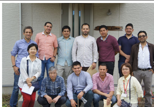
木造モデル住宅の見学