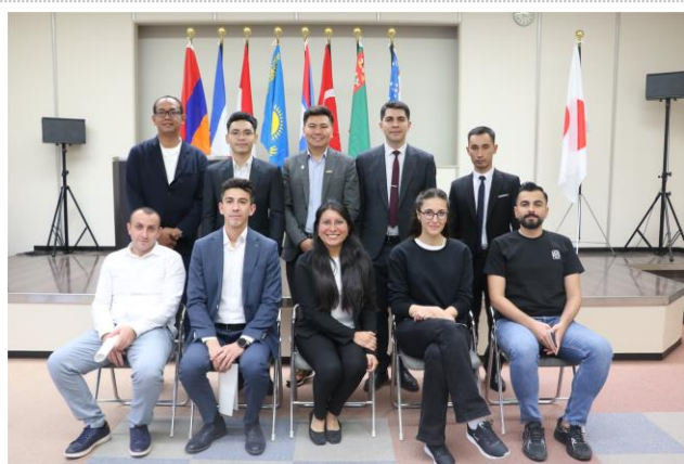
集合写真（研修生のみ）